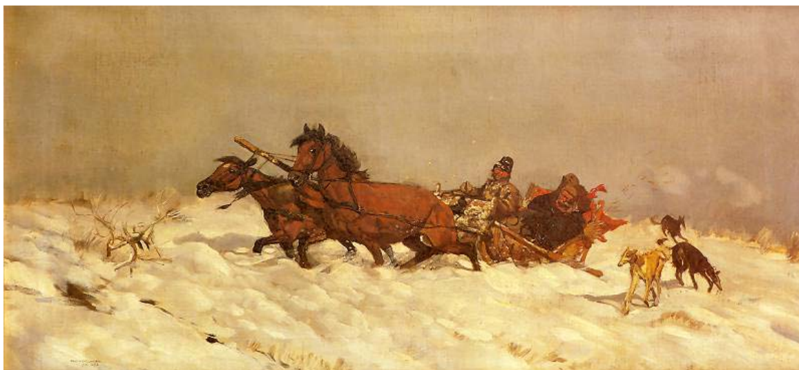
Józef Chełmoński "Zima w Polsce", 1882 r.